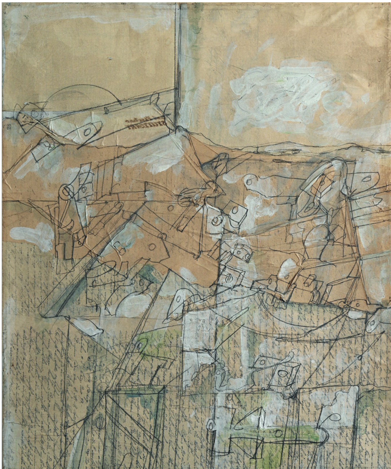
Collage mit Übermalung - 1971 Leinwand, 50 x 60