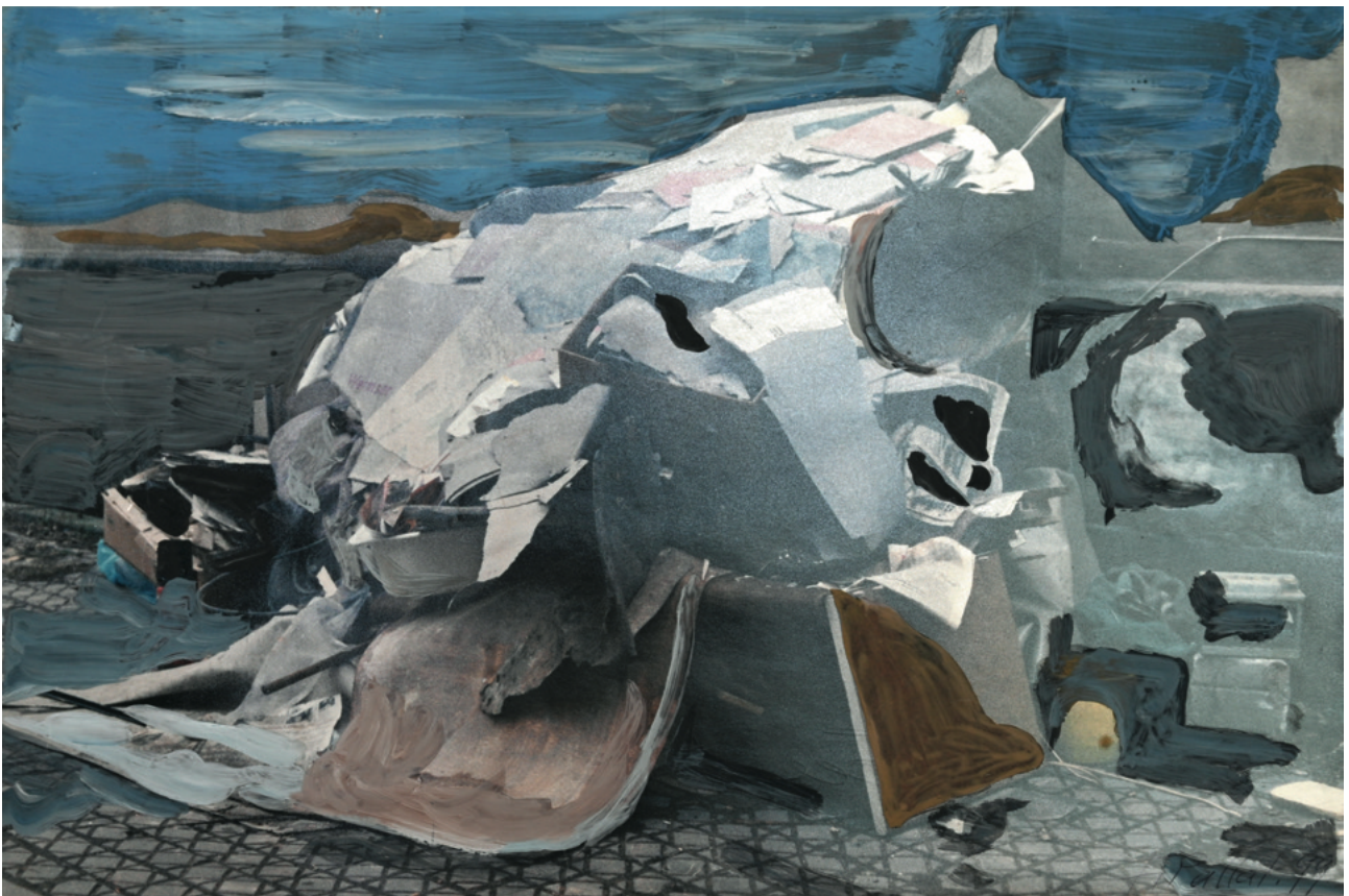
Defektes Gerät - 1999 Übermalung auf Fotopapier, 45 x 30