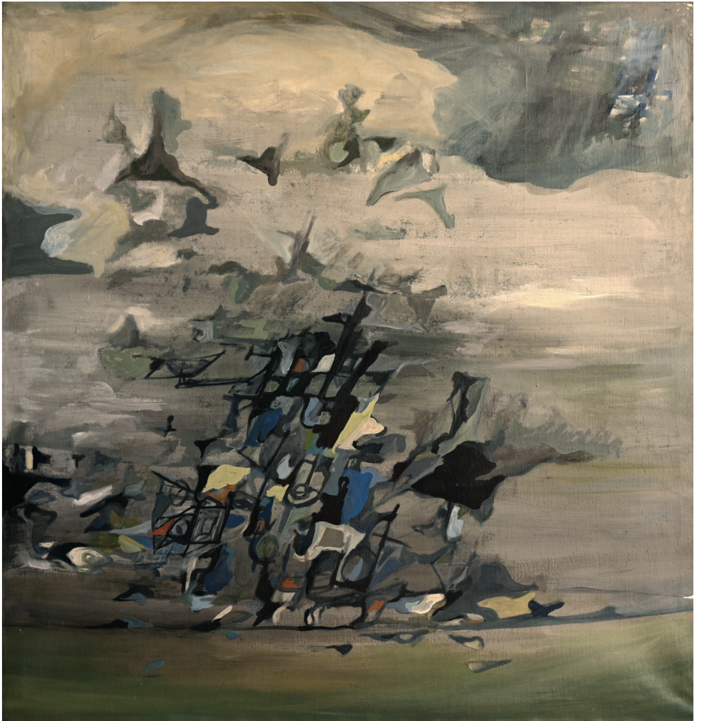
Malerei auf Leinwand - 1980, 115 x 120