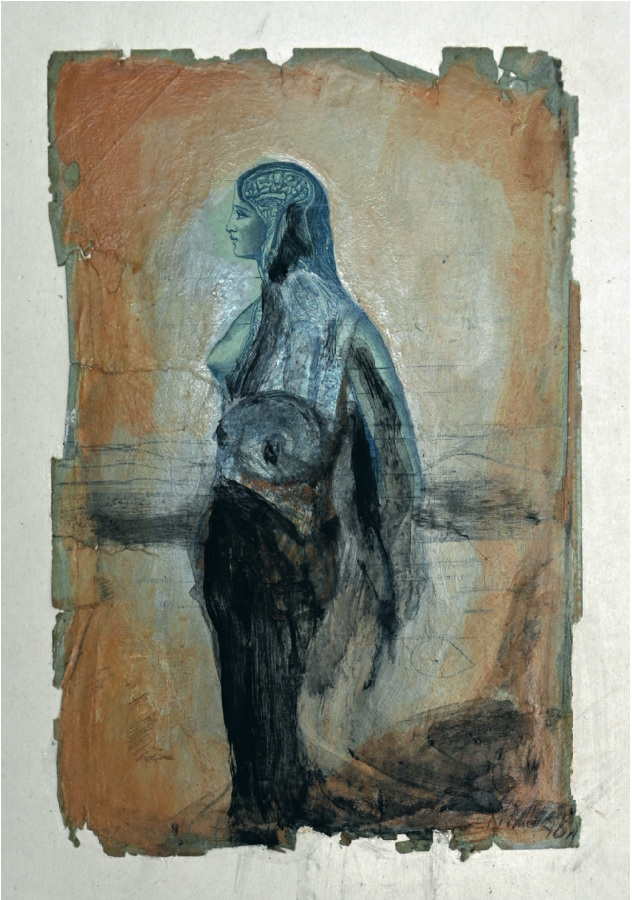
Collage mit Übermalung - 1976, 15 x 24