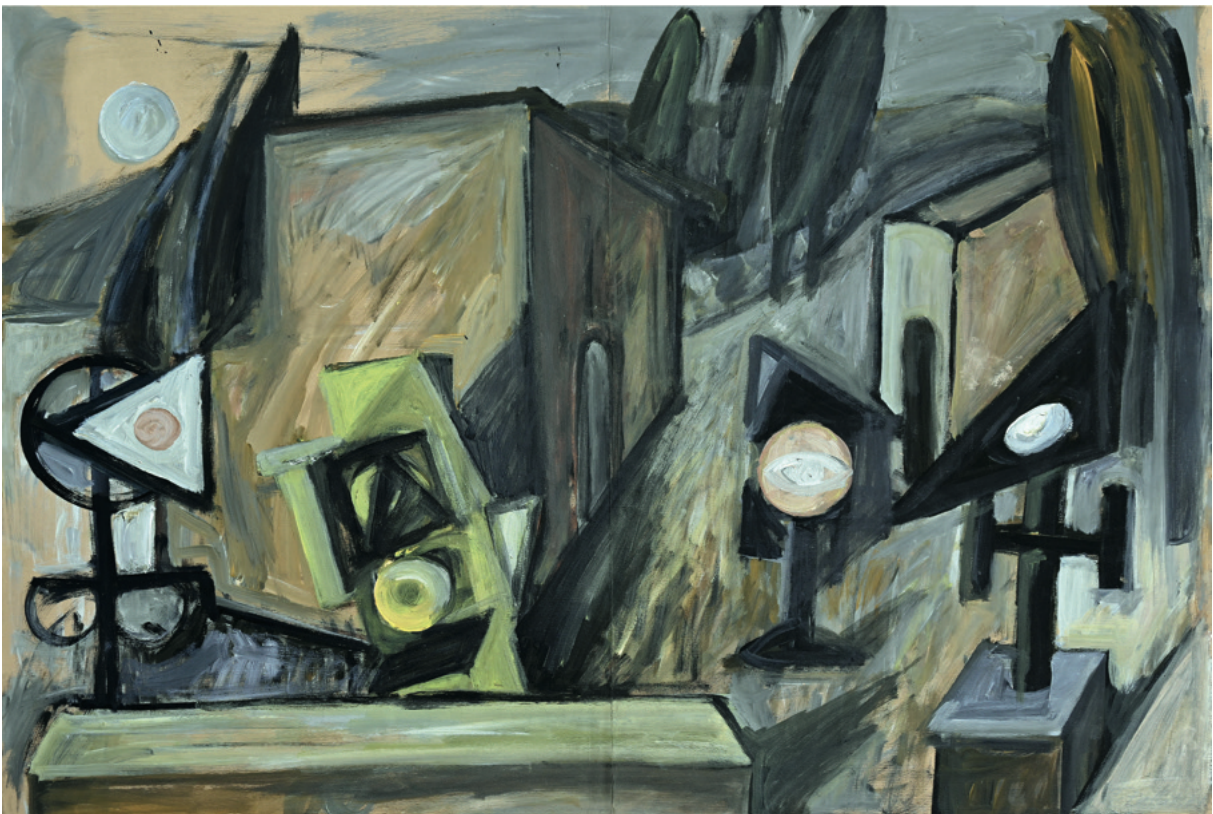
San Casciano - 1982 Acryl auf Papier, 80 x 54