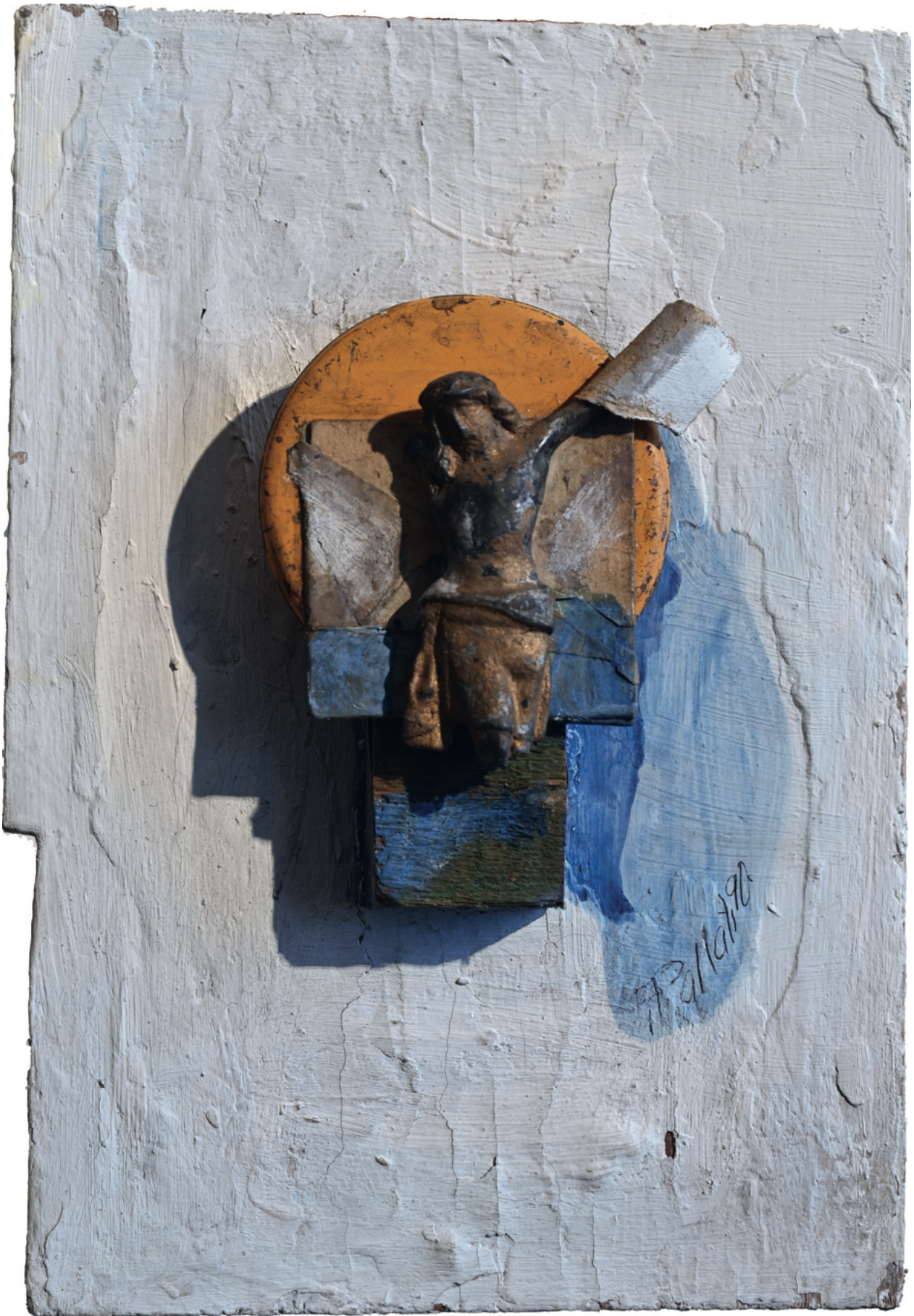
Weisse Fahne - 1990 Assemblage mit Übermalung, 19 x 27