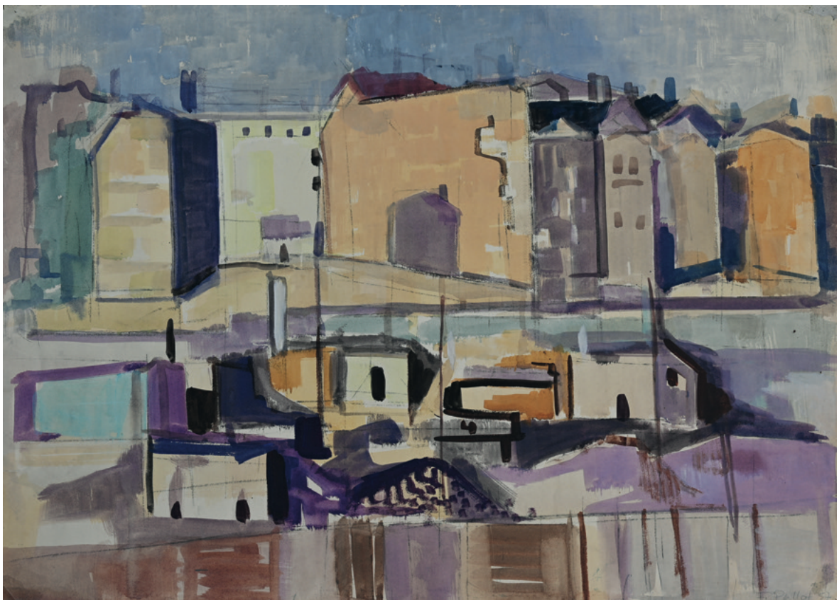
ohne Titel - 1957 Malerei auf Papier, 82 x 56