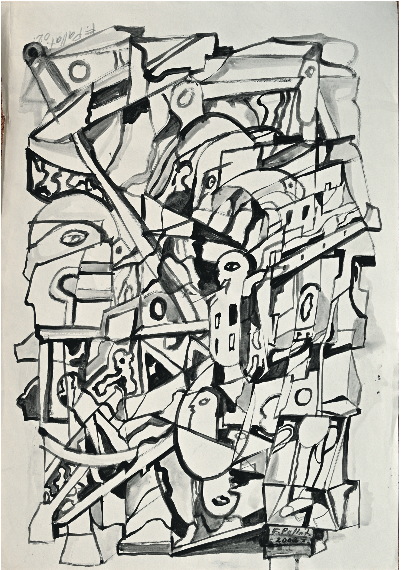
Der Dirigent - 2002 Tusche auf Papier, 44x 63