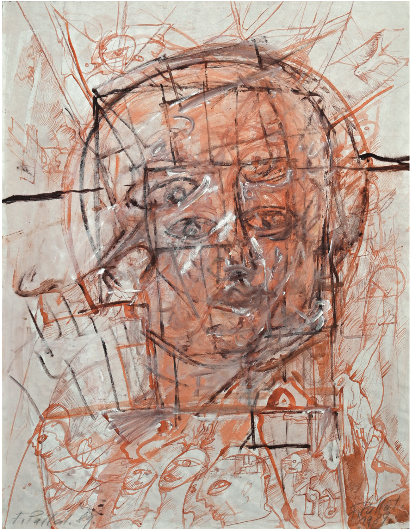
Selbstportrait - 1989 Malerei auf Papier, 48 x 62