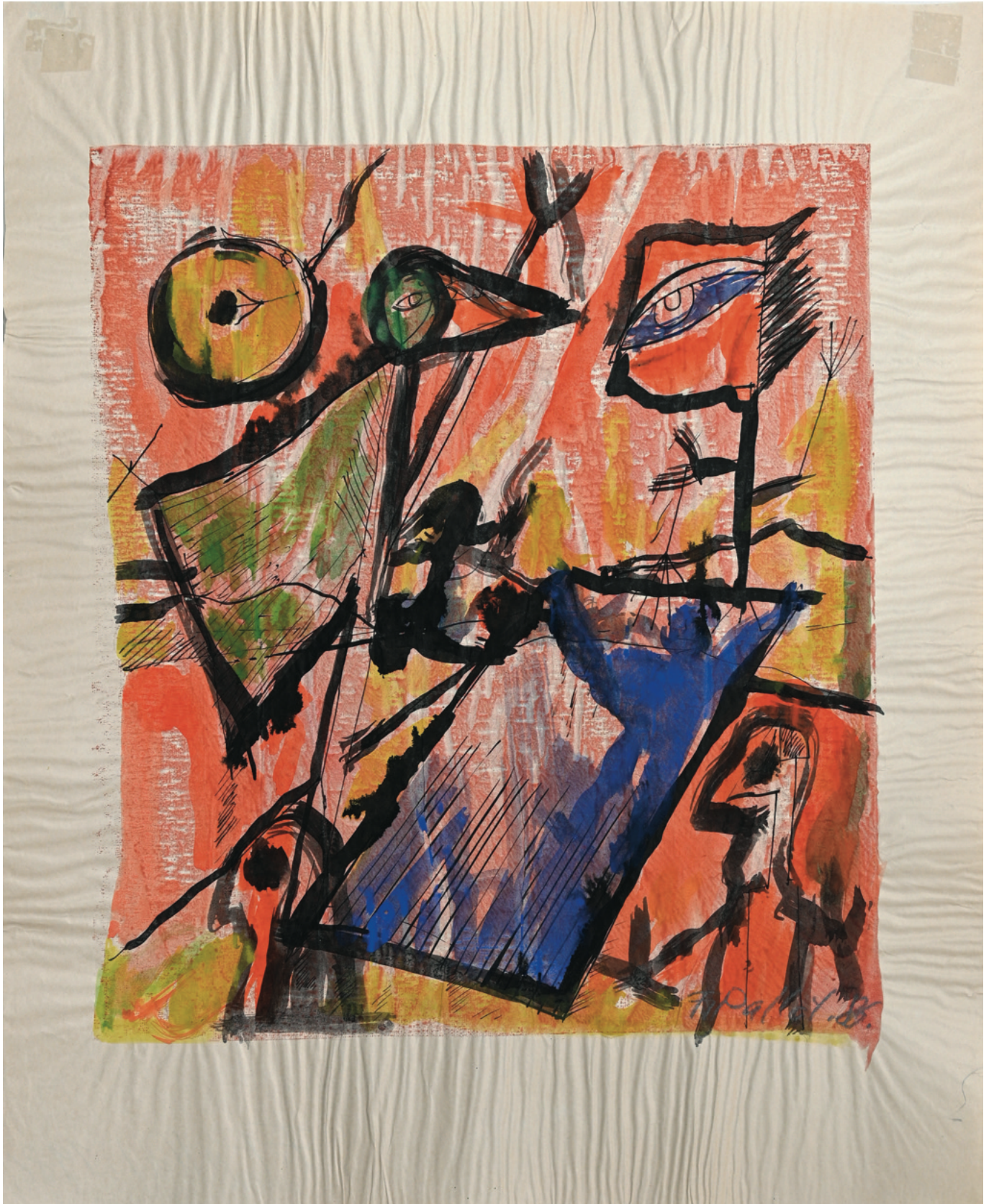
Malerei auf Transparentpapier - 1986, 38 x 46