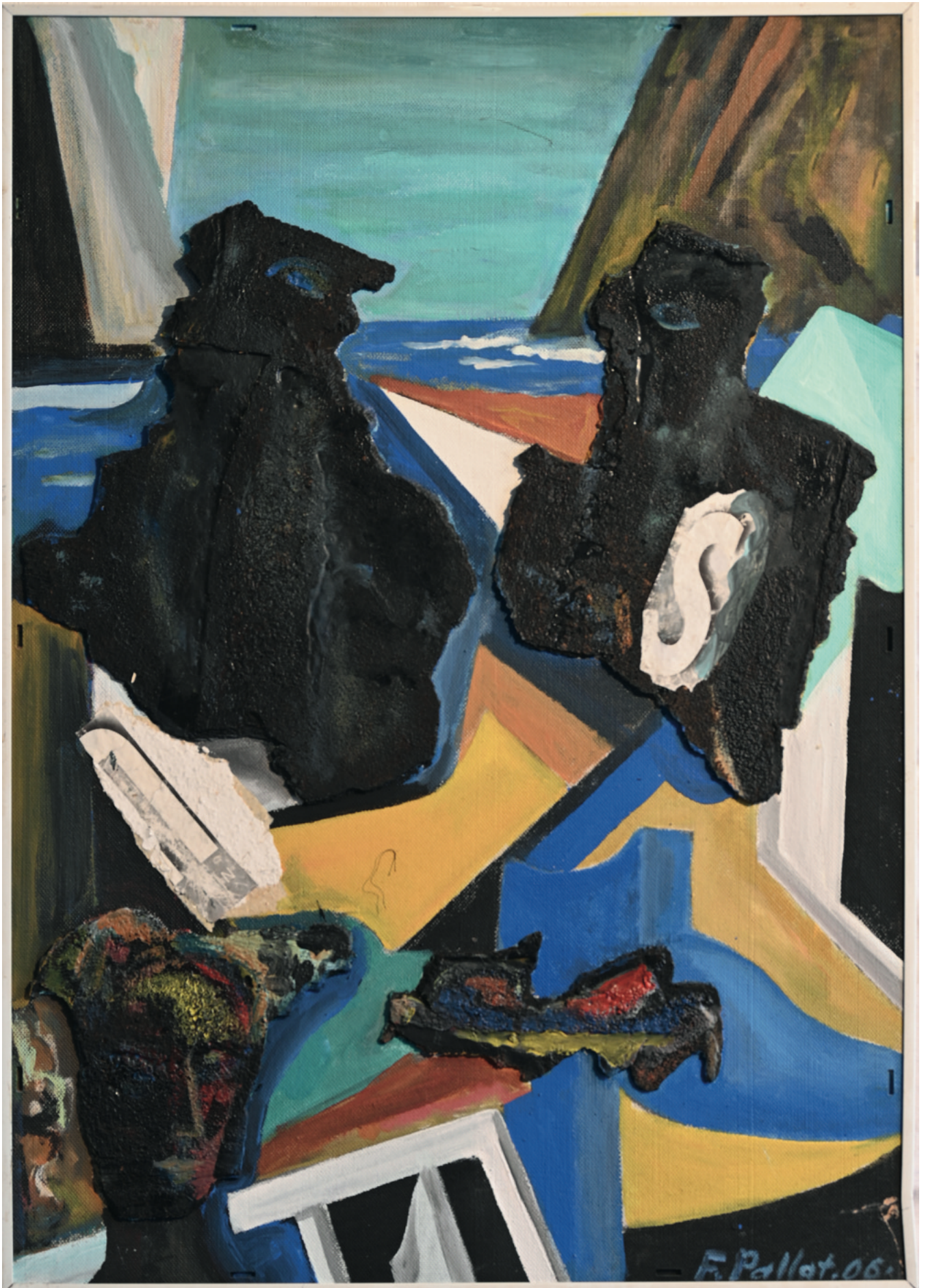
Gespräch im Boot - 2006 Assemblage mit Übermalung, 70 x 100