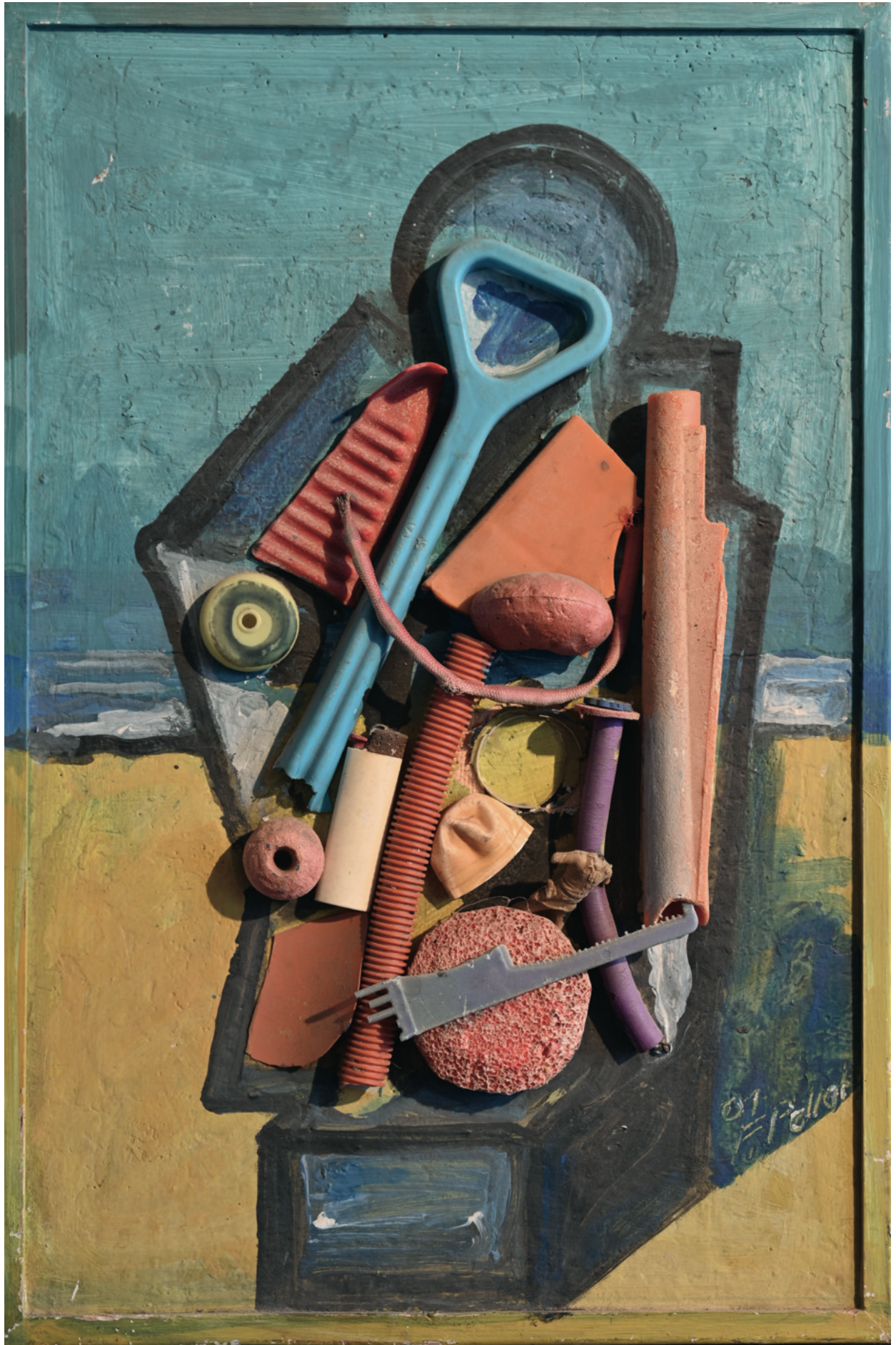
ohne Titel - 2001 Assemblage mit Übermalung, 40 x 60