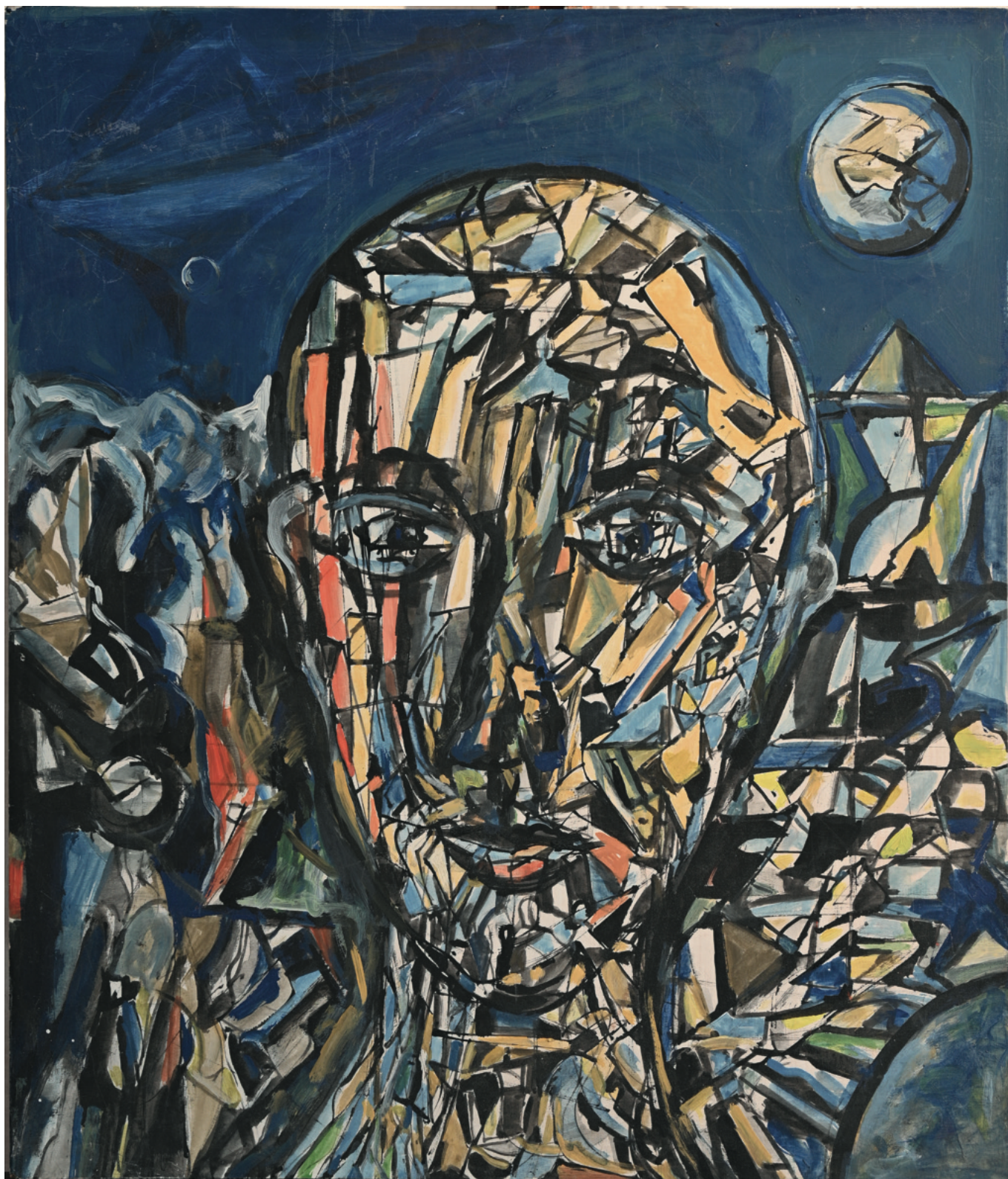
Astronaut - undatiert Malerei auf Platte, 59 x 67