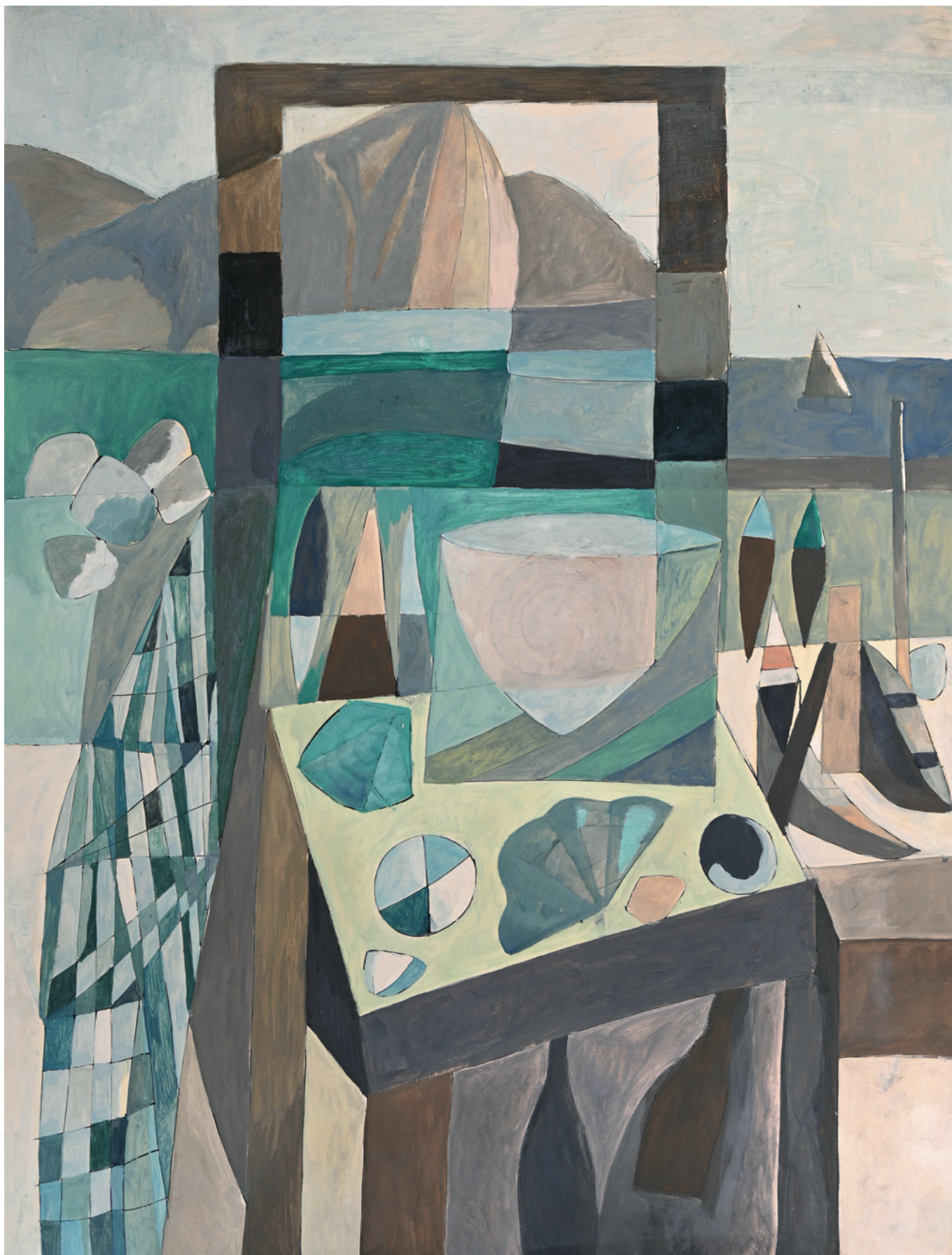
Stilleben - 1966 Malerei auf Papier, 59 x 70