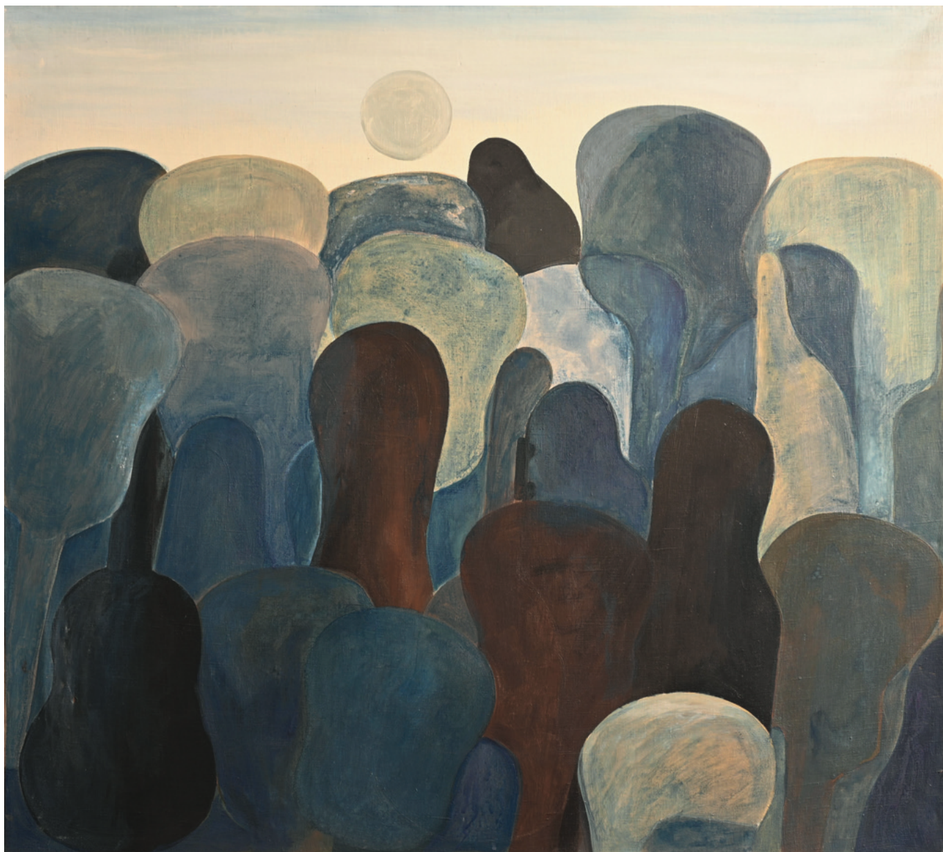
ohne Titel - 1975, Leinwand, 100 x 90