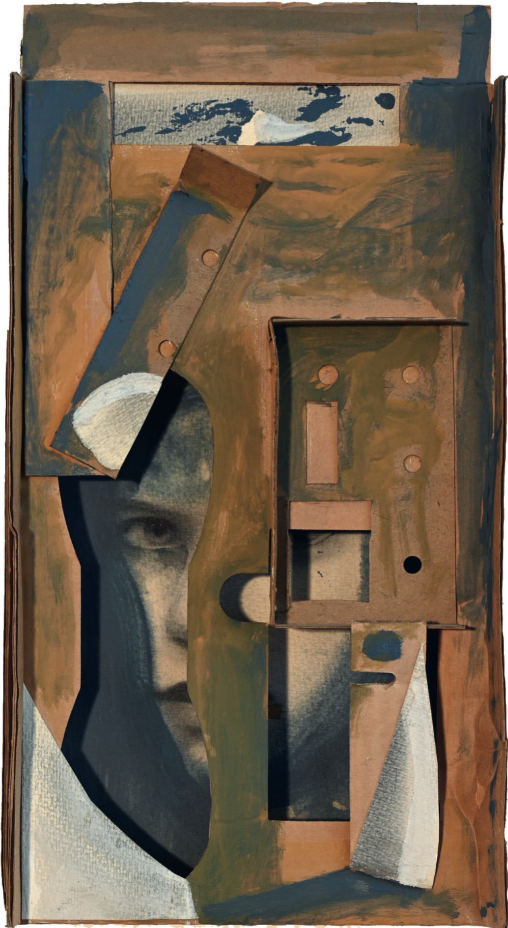
Mondgedanken - 1997 Collage mit Übermalung, 21 x 39