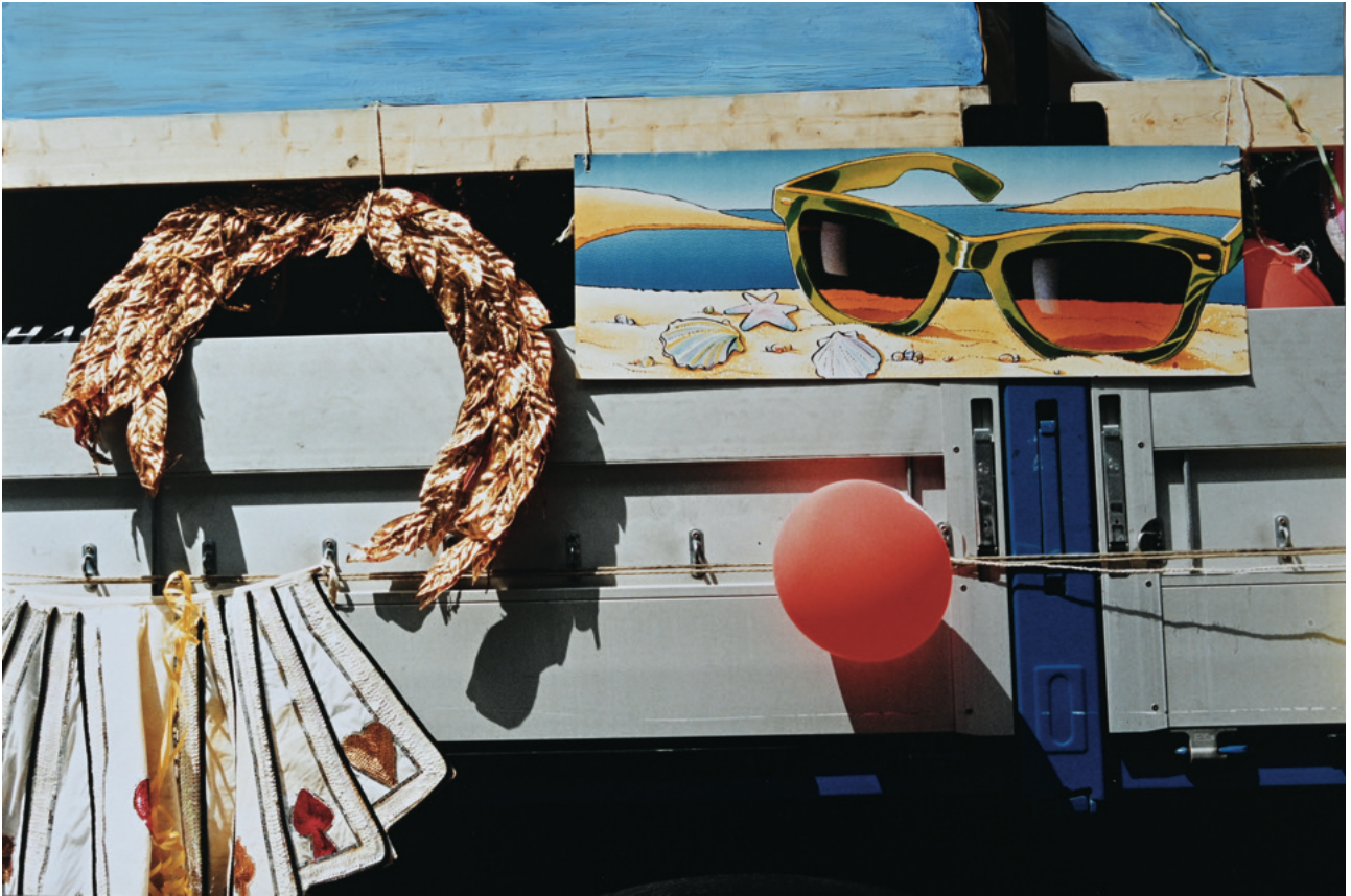
Dekoriertes Schiff - 2001 Photocollage mit Übermalung, 45 x 30