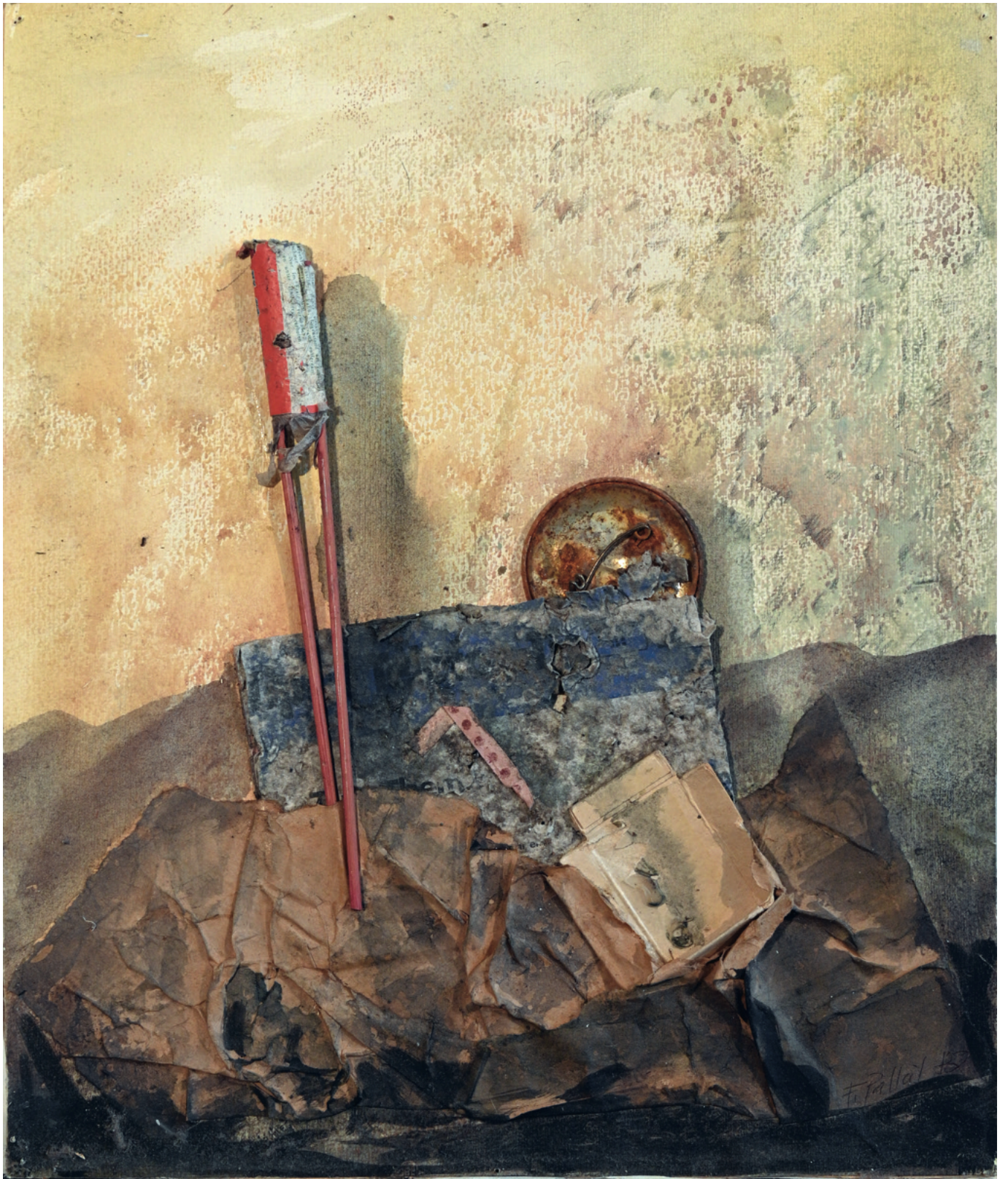
Firenze - 1982, Assemblage mit Übermalung, 30 x 36