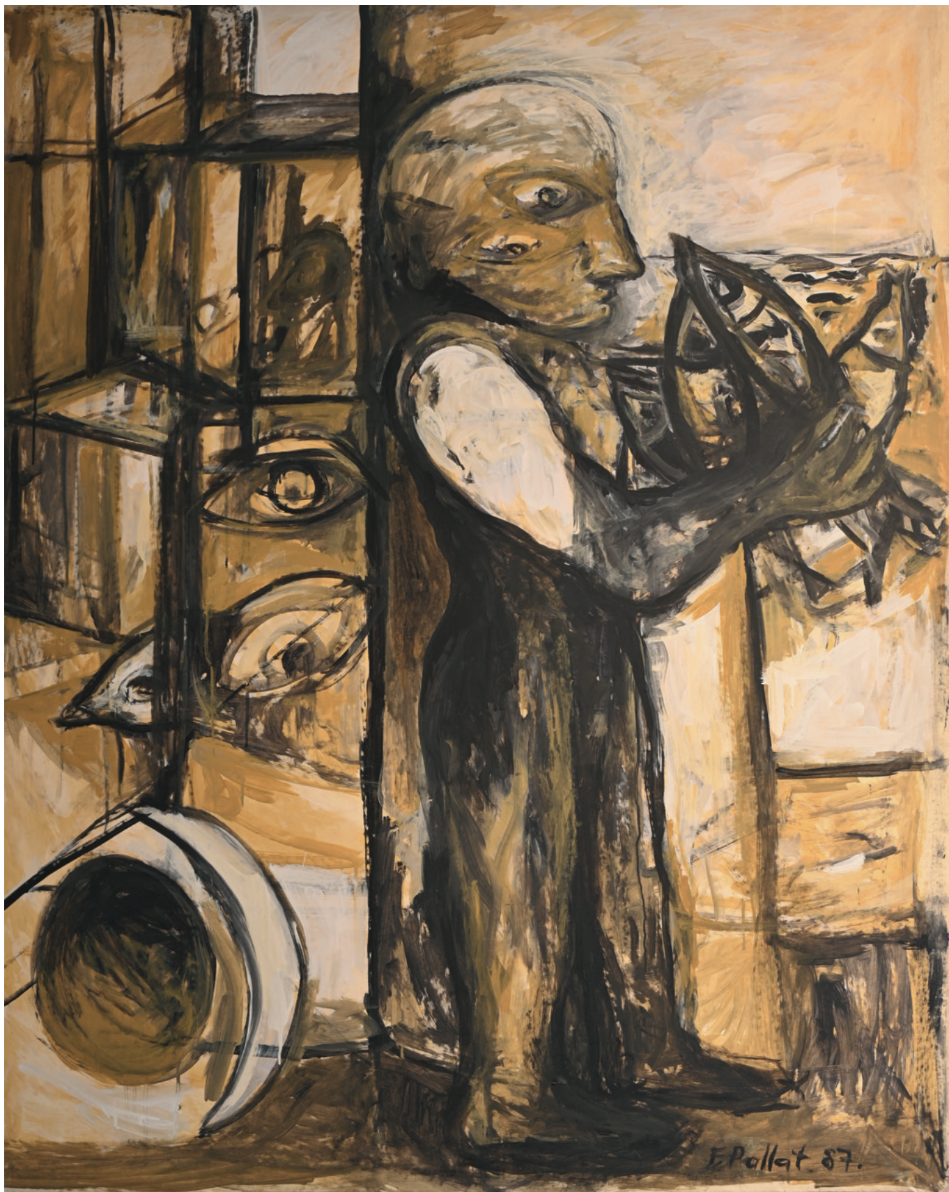
Der Mann mit dem Fisch - 1987 Leinwand, 135 x 173