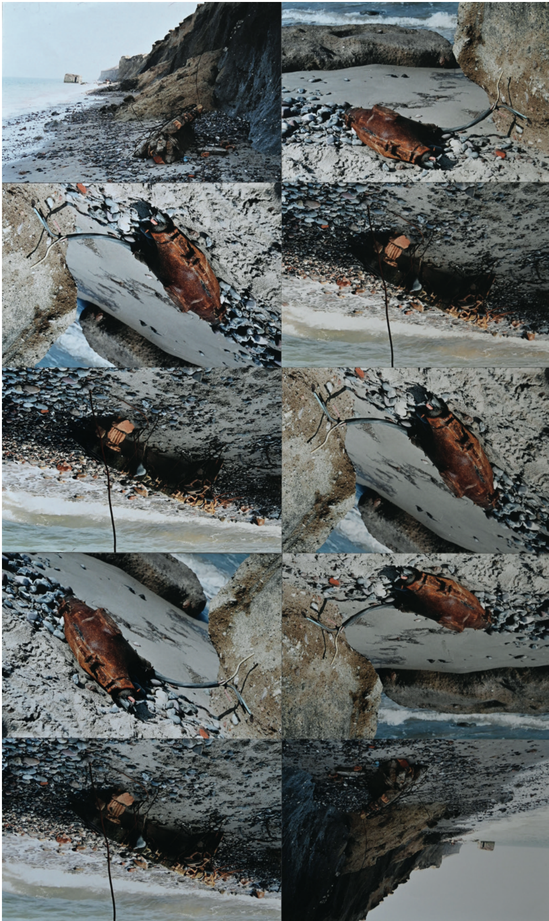
ohne Titel - 2002, Photocollage, 54 x 89