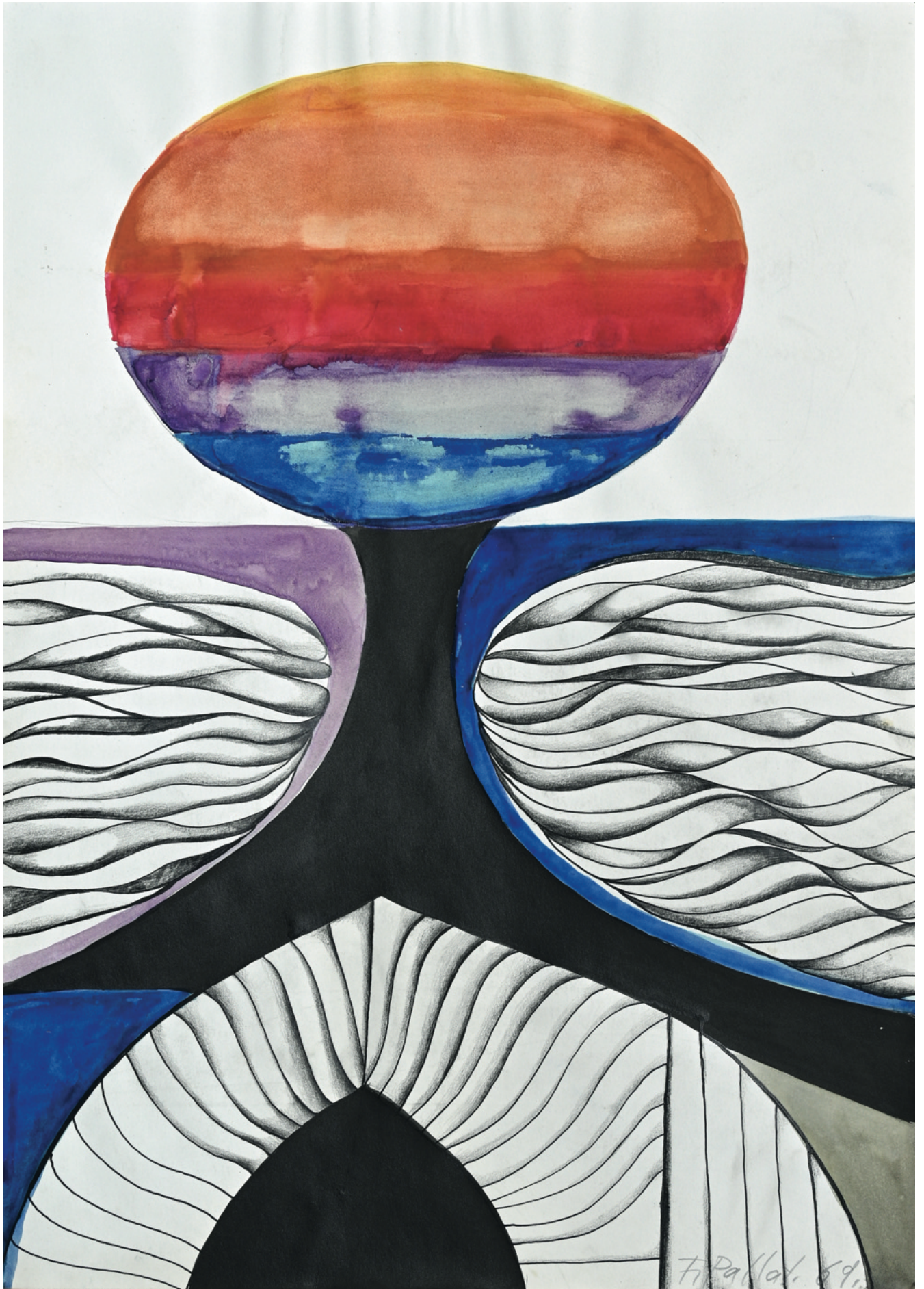
Aquarell und Stift auf Papier - 1969, 35 x 49