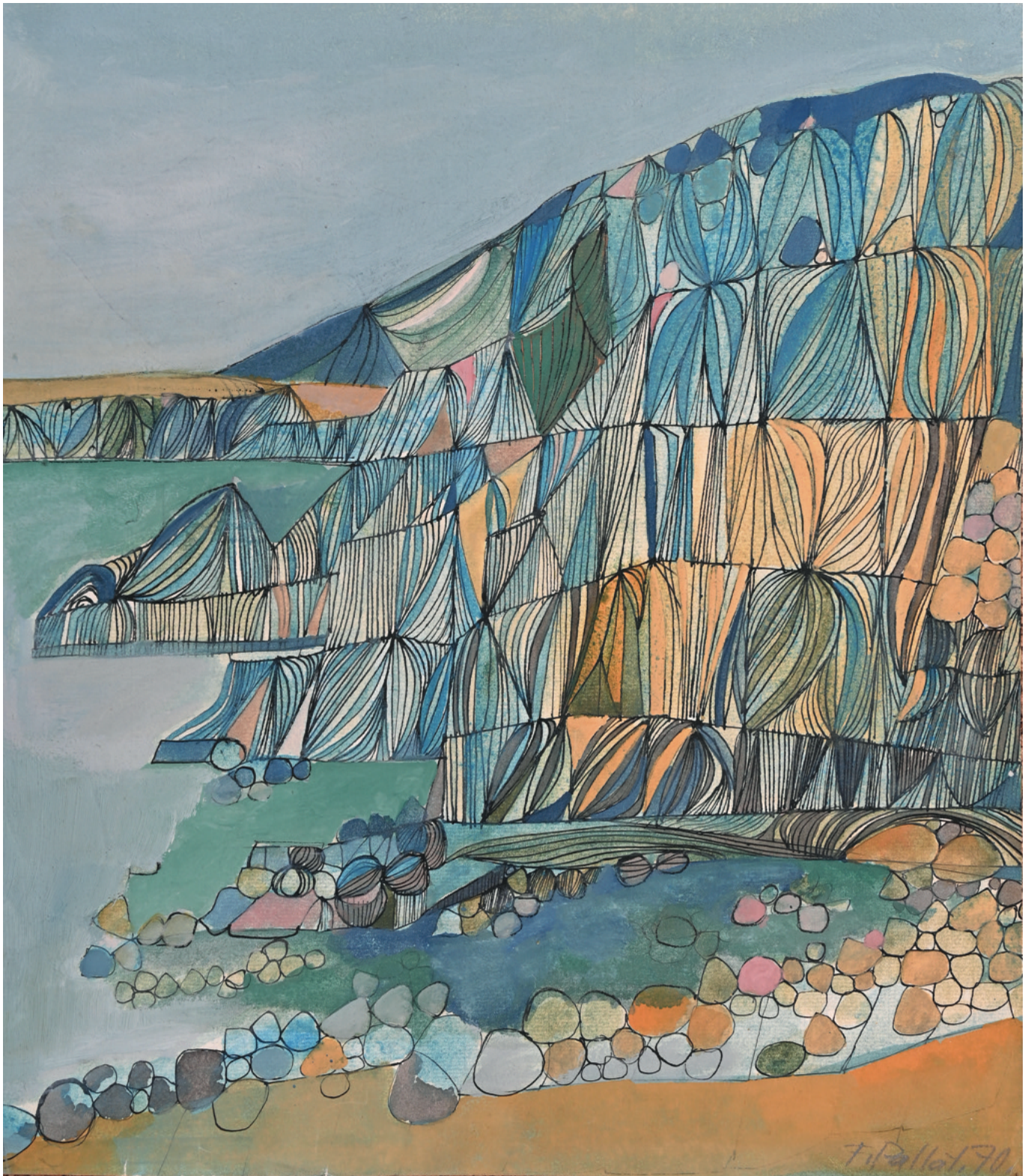
Malerei und Tusche auf Papier - 1970, 30 x 42