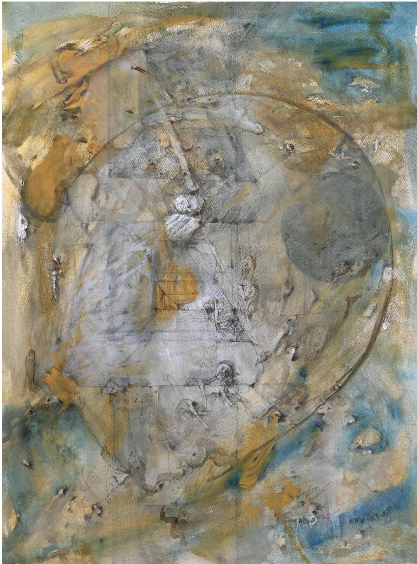
Malerei auf Papier - 1988, 55 x 75