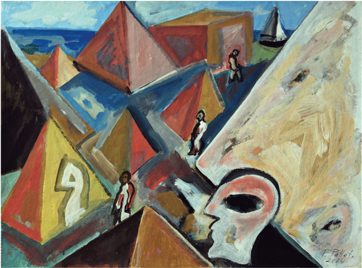
Stadt der Kegelbauten - 2004 Acryl auf Papier, 80 x 60