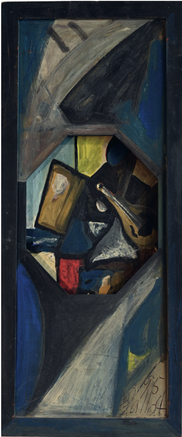
Beobachter - 1995 Malerei auf Altholz, 30 x 72