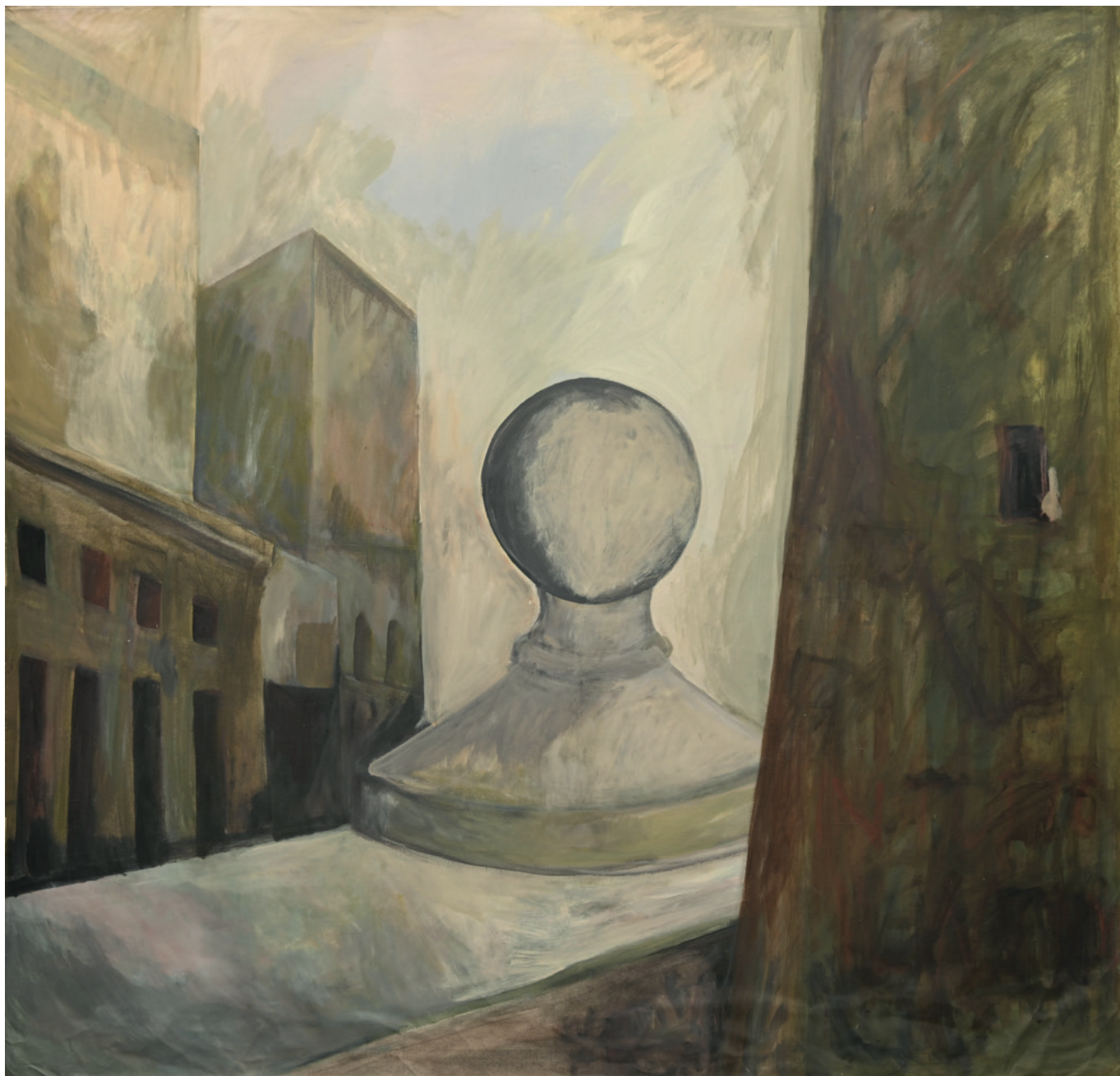
Malerei auf Leinwand - 1978, 120 x 114