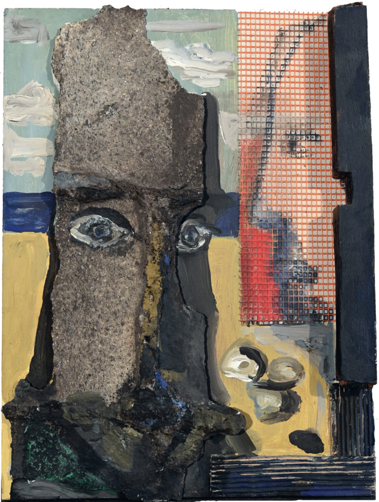
Visionäres Gespräch - 2011 Assemblage mit Übermalung, 31 x 41