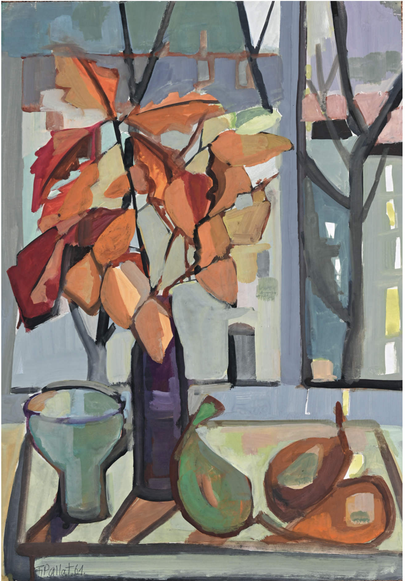
Stilleben - 1961 Malerei auf Papier, 42 x 60