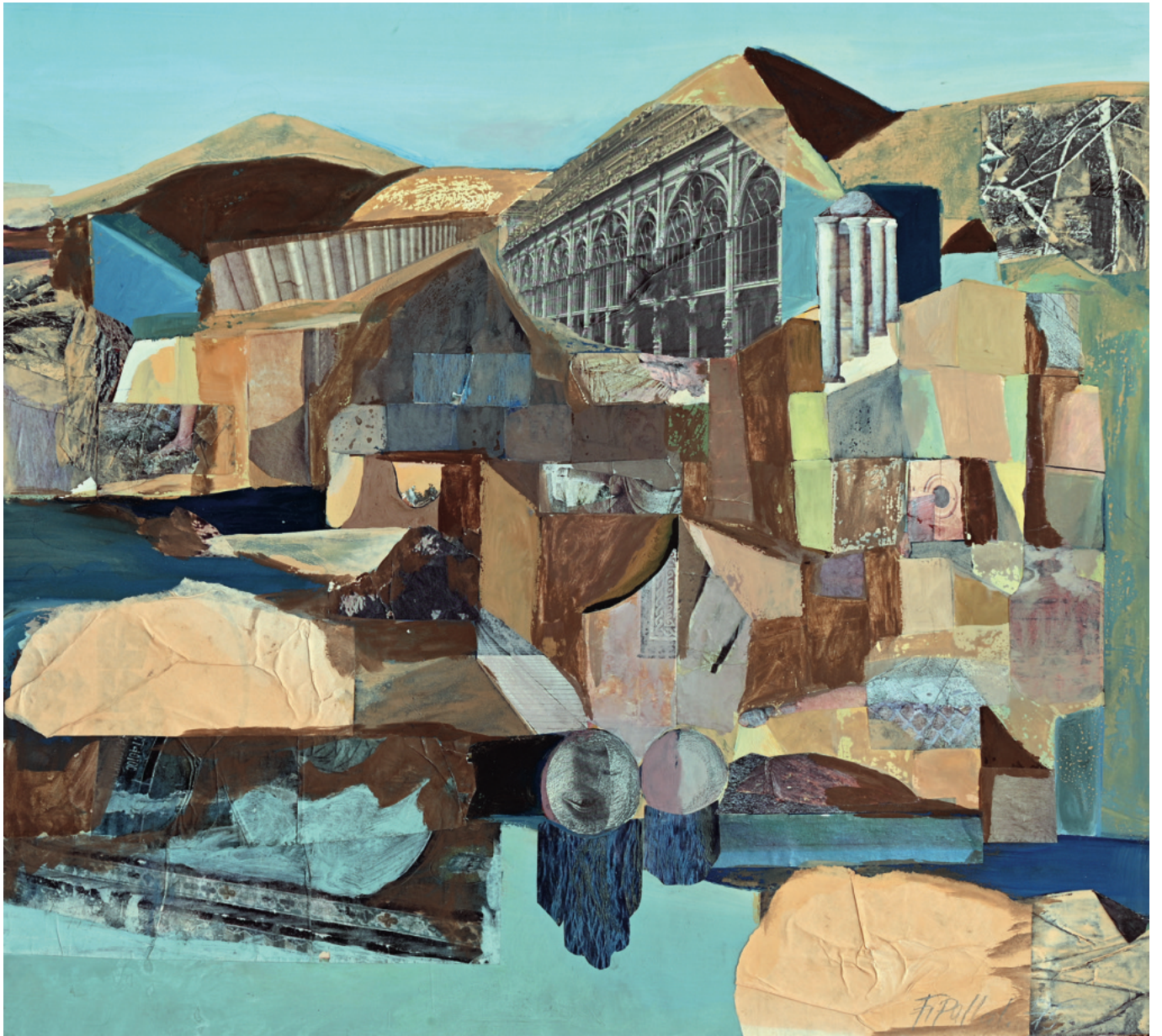
Collage mit Übermalung - 1975, Papier, 67 x 61