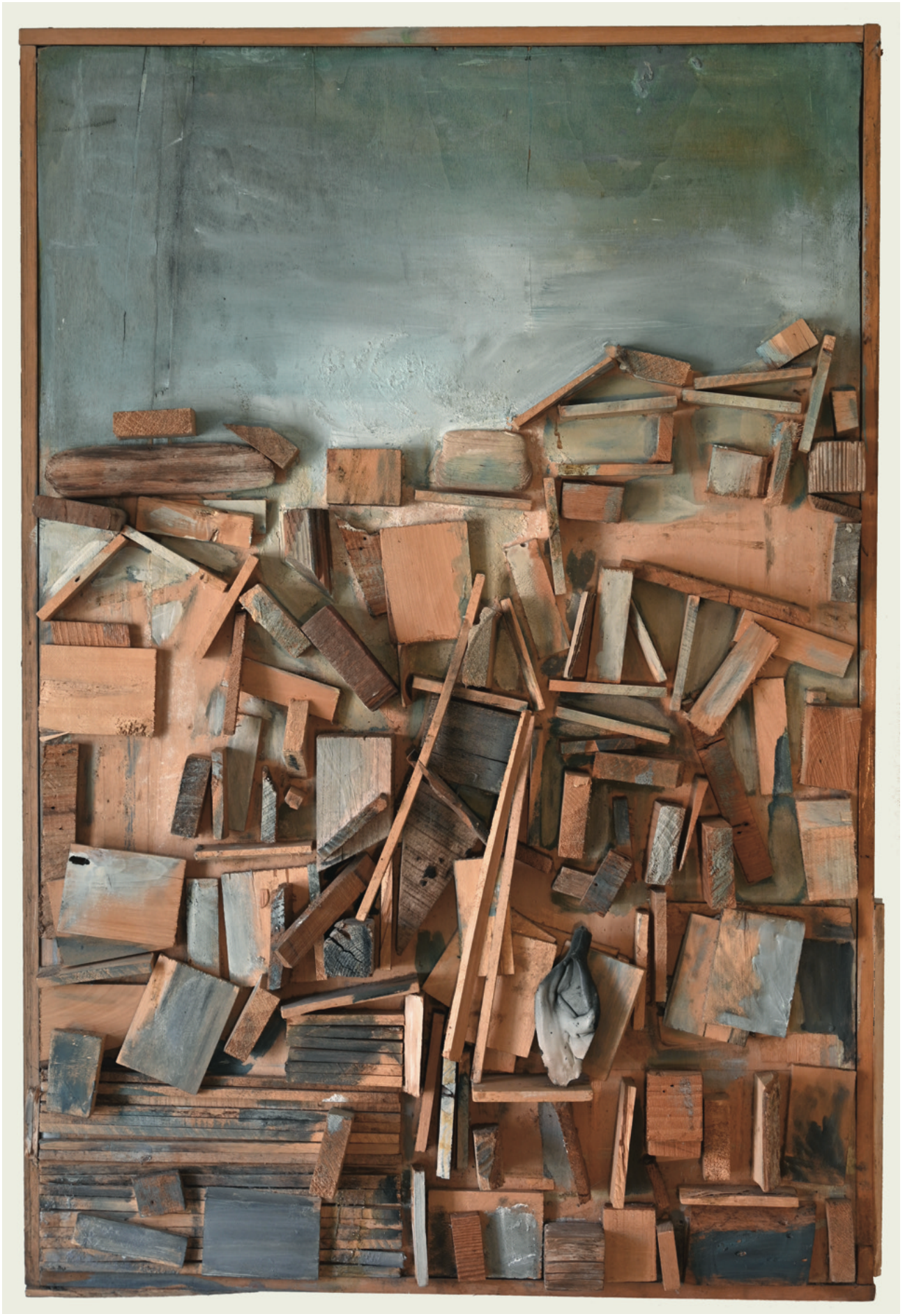
San Casciano - undatiert Assemblage Holz mit Übermalung, 78 x 115