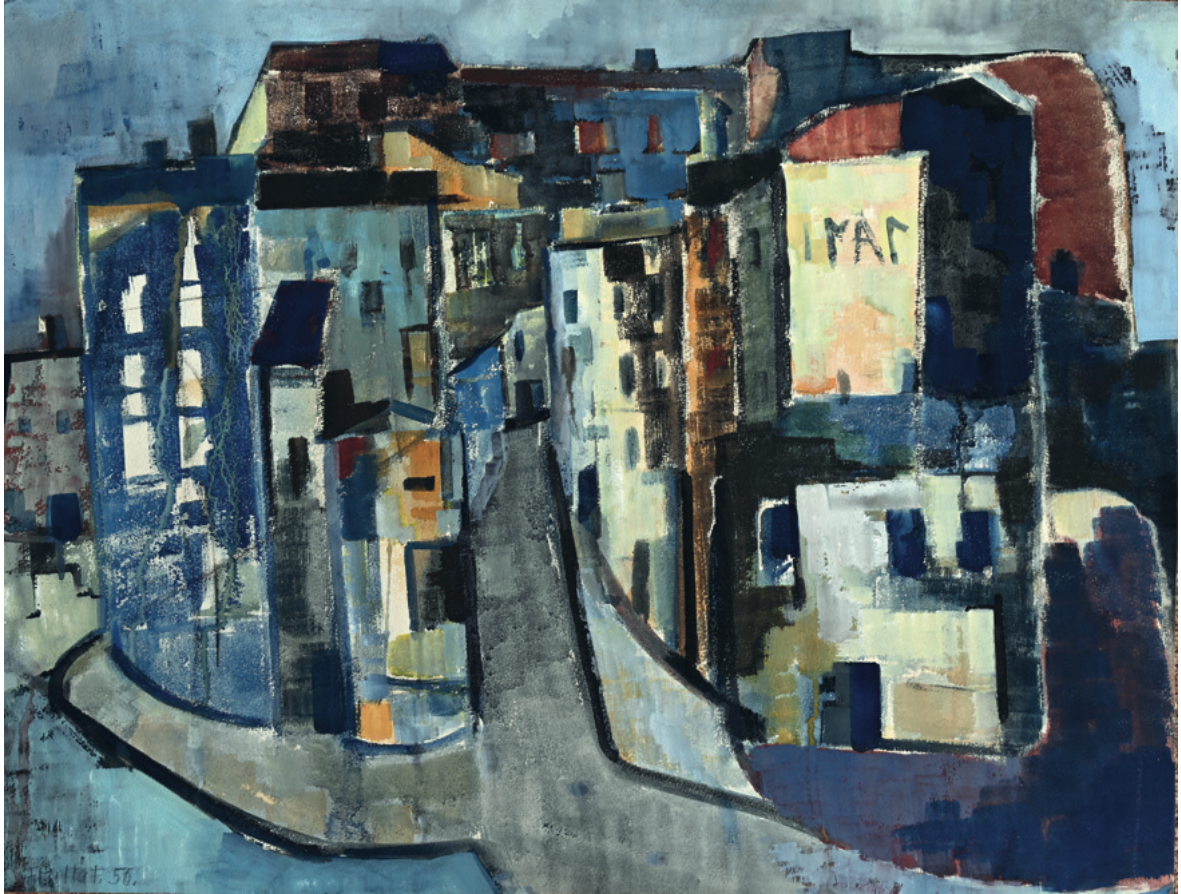
ohne Titel - 1956 Malerei auf Papier, 74 x 56