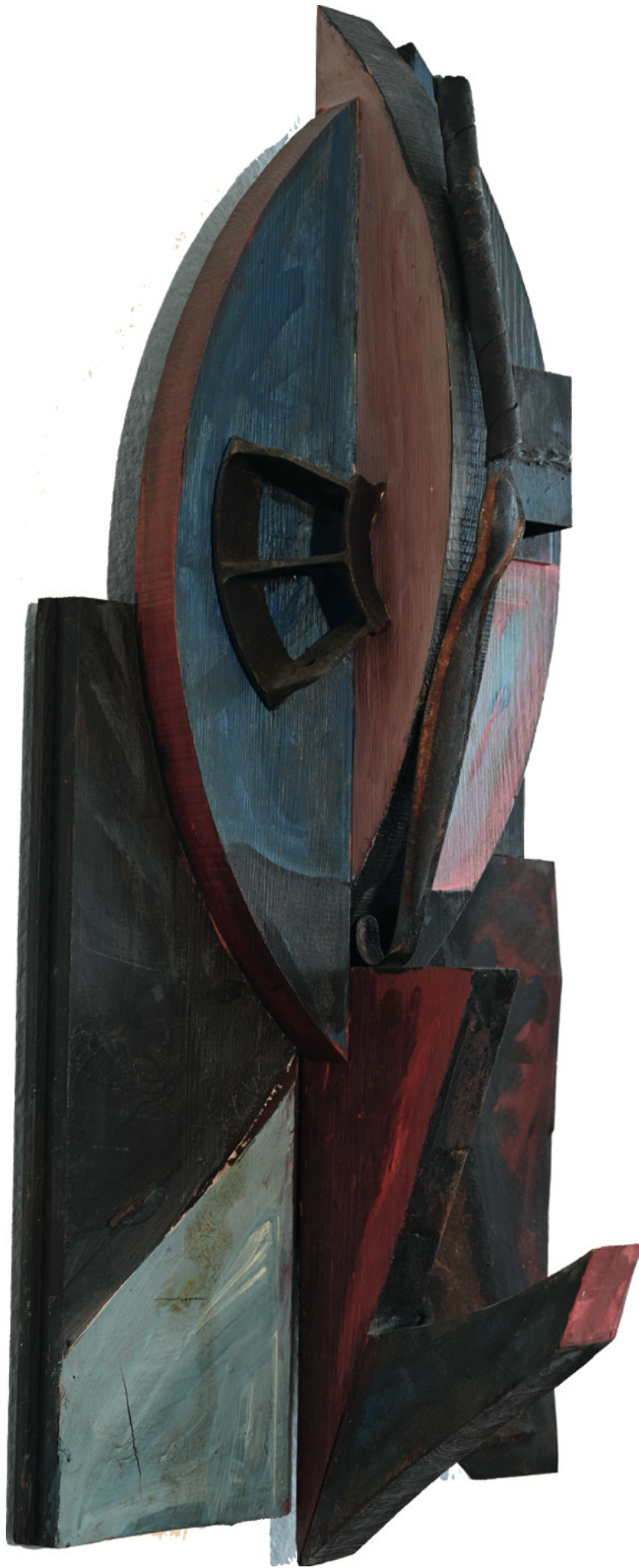
Hängeobjekt - 1983 Holz mit Übermalung, 31 x 77 x 24