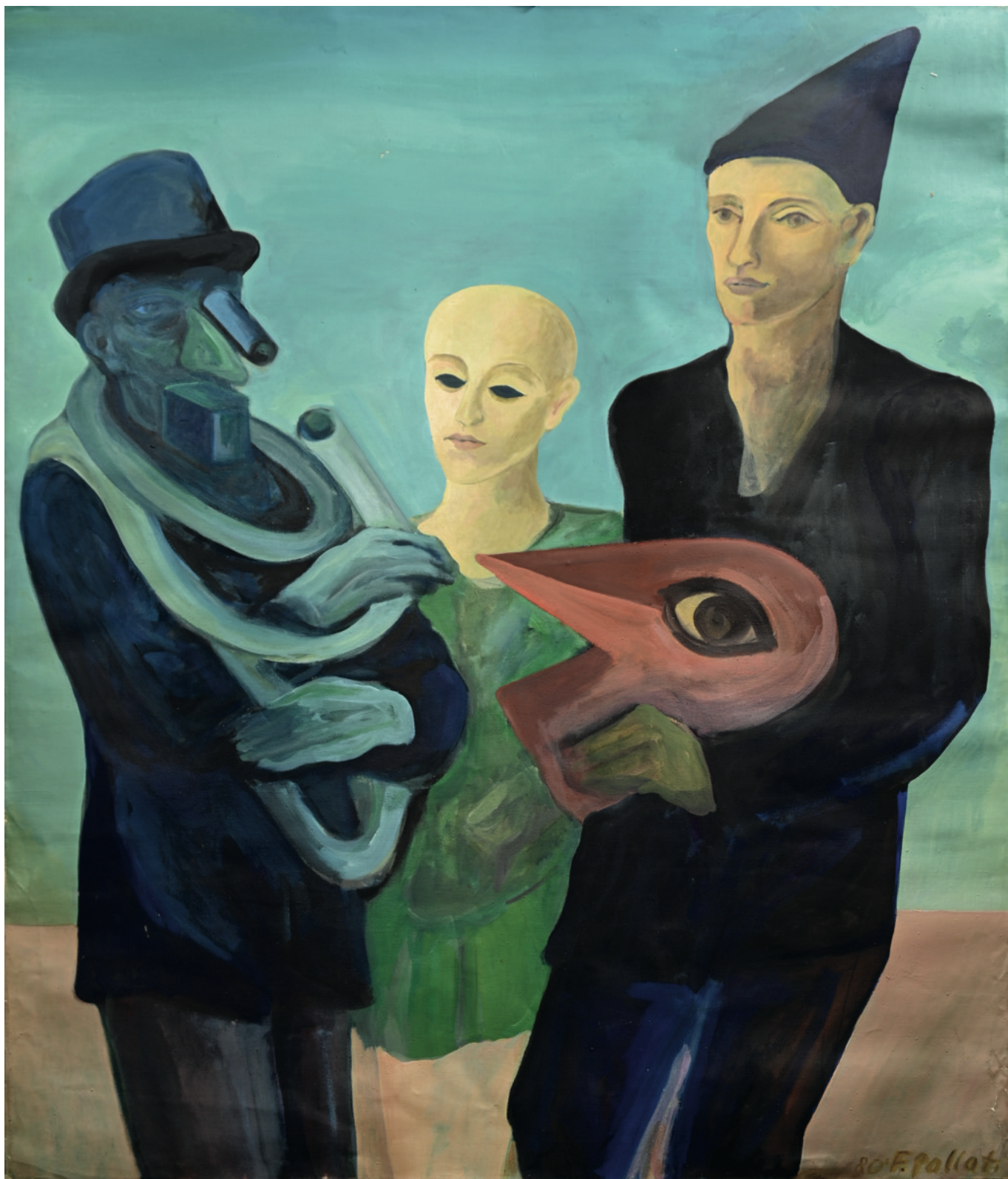
ohne Titel - 1980 Malerei auf Leintuch, 100 x 120