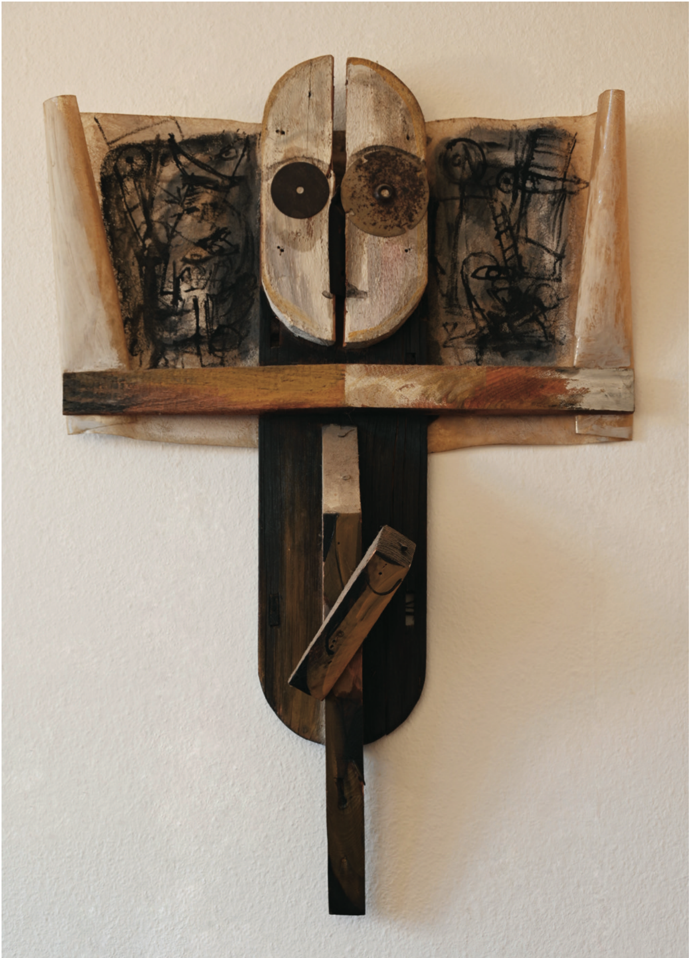
Der Wächter - 1994 Objekt Holz, Kunststoff, 78 x 118