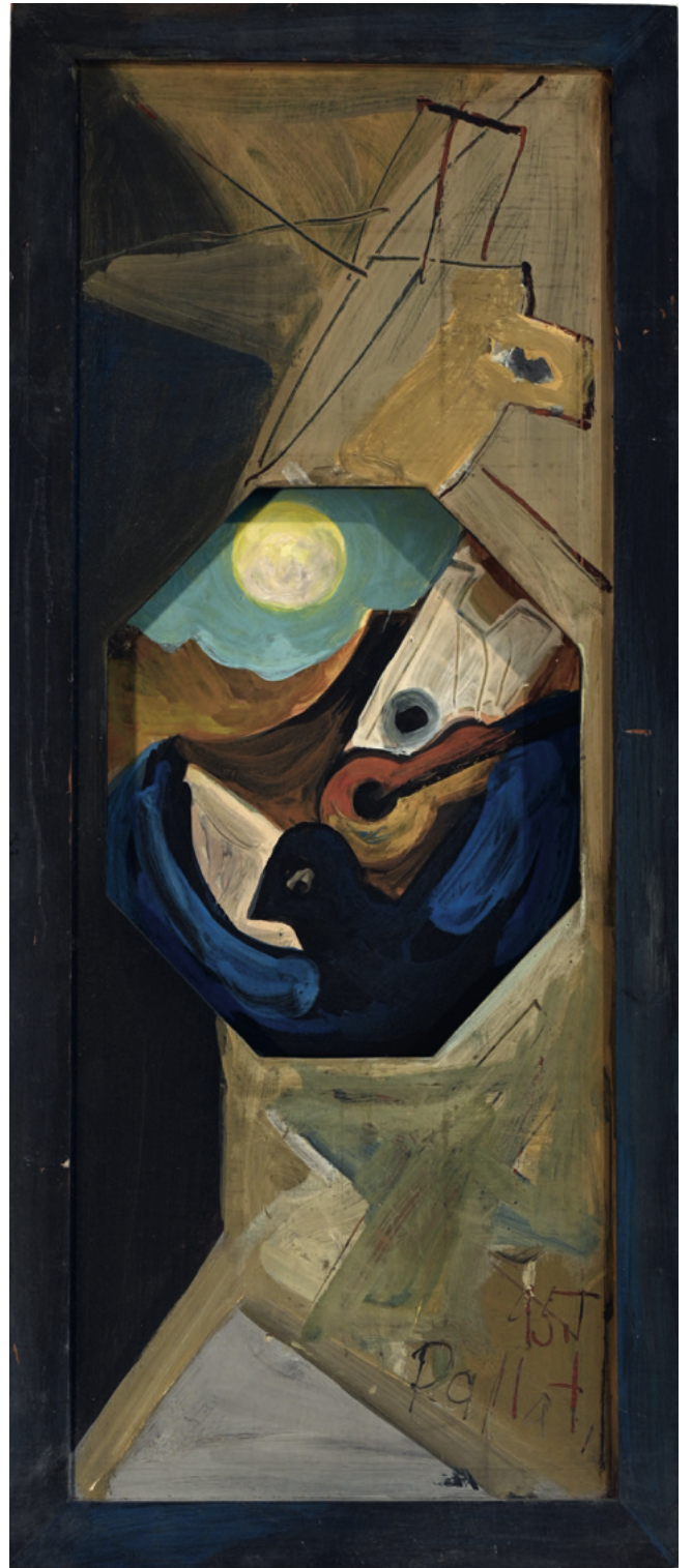
Blauer Vogel - 1995 Malerei auf Altholz, 30 x 72