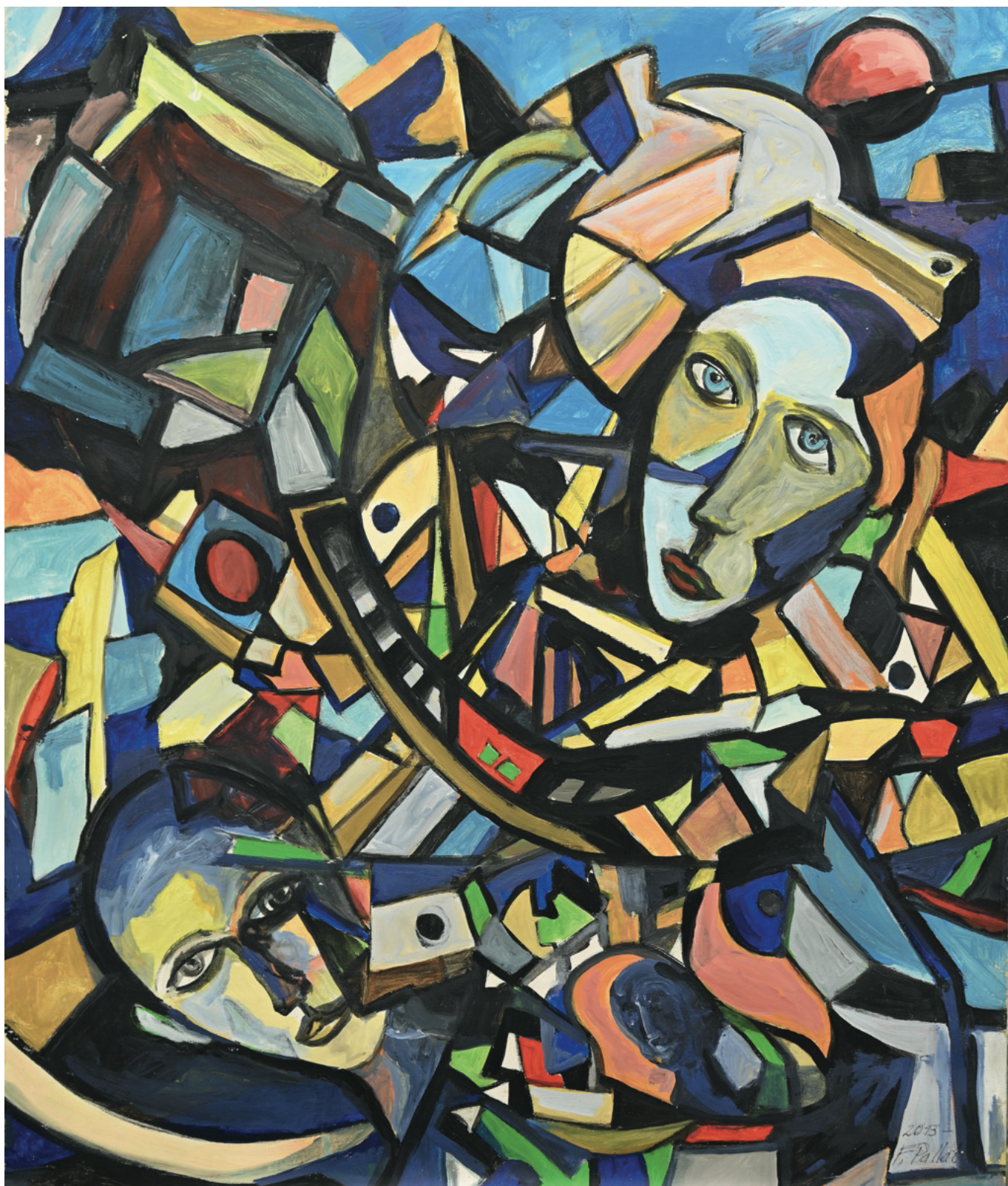
Leben in Bewegung - 2013 Acryl auf Leinwand, 80 x 98