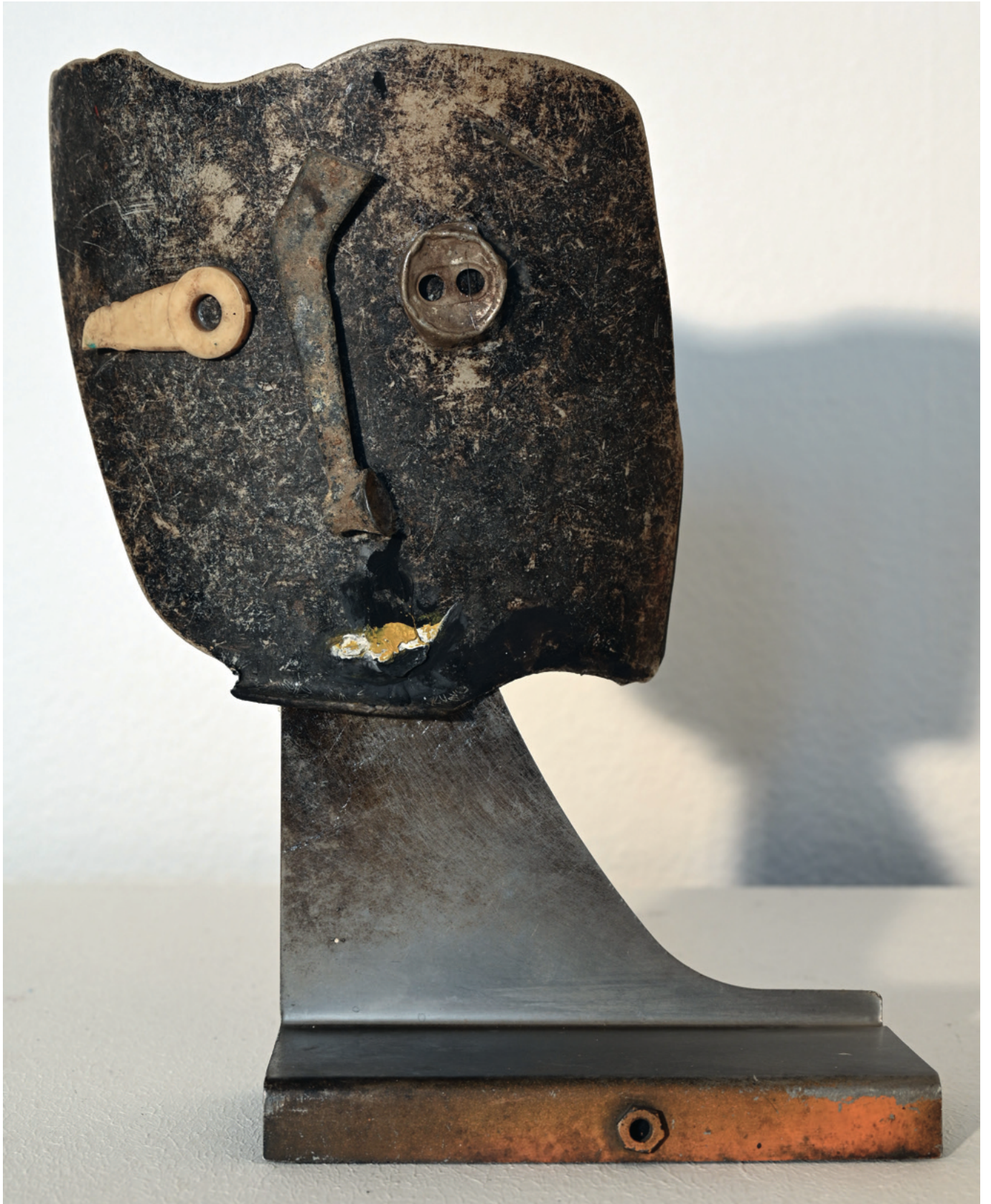
Der Poet - 2005 Assemblage Stahl, 13 x 35 x 15